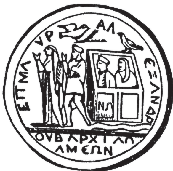
Moneda frigia en la que se representa el arca (201 a 210 después de Cristo), durante el reinado del emperador Septimio Severo.